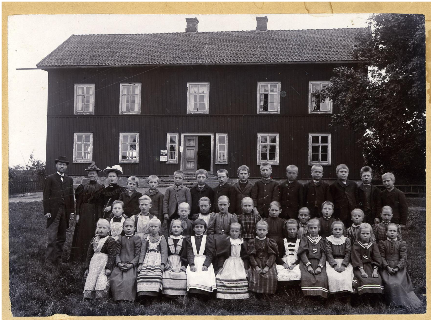
Nydala skola, år?