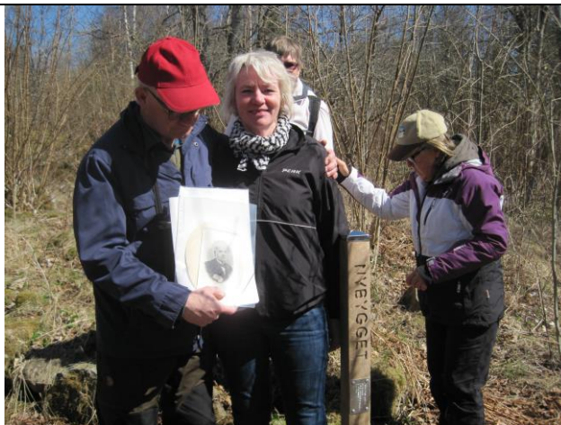
Torpinventering maj 2013.