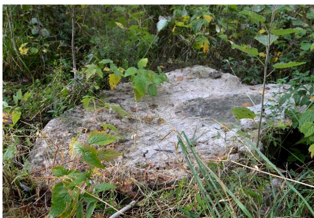
Trappstenen till torpet