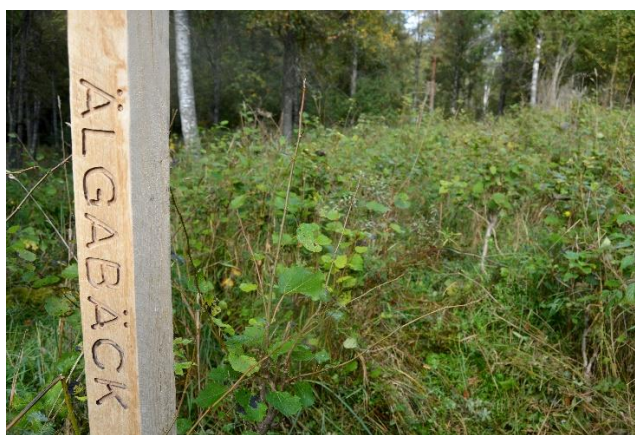
Torpområdet vid Älgabäck