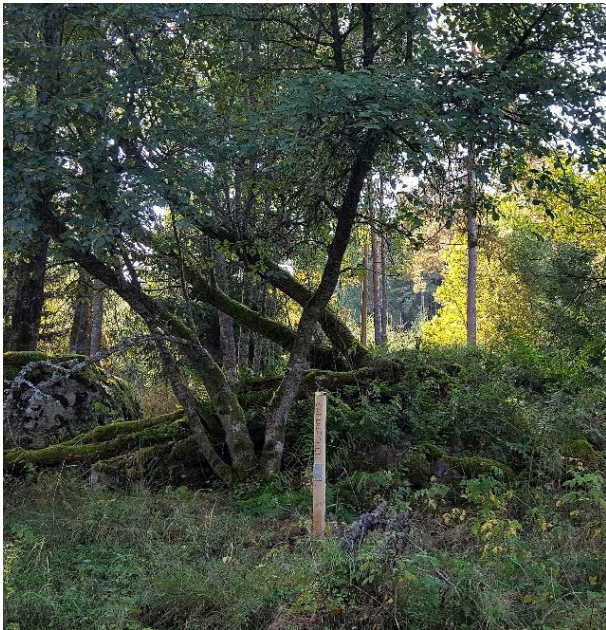
Markeringsstolpe vid torpet Sandbäcken