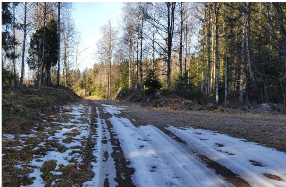
Torpet Backen anses ha legat där vägen går upp mot Ekåsbacken.