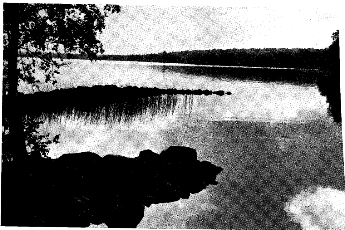
Vågbrytarna utanför Järnuddens nothus.

Siklöjan leker i slutet av november och början av december. Under lektiden fångas den mesta småsiken. I Wikströms ungdom kunde man få stora fångster på upp till 200 kg på varje länk. Då betalades siklöjan med 50 à 60 öre per kg. Numera kan Thure Wikström få 15 kg på varje länk, och då anser han, att fiskelyckan varit god. Även om siklöjan nu för tiden betalas med 2,25 per kg, har fiskaren ej samma lön för mödan som förr. Utom vid lektid fångas småsik från maj till november.