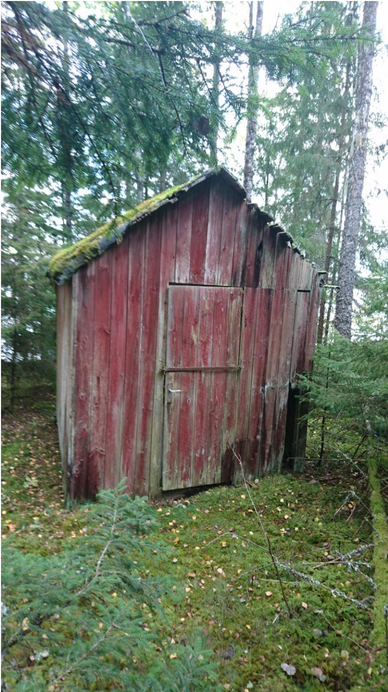
Wikströms fiskestuga på västra sidan av Rusken. FOTO, 20180930