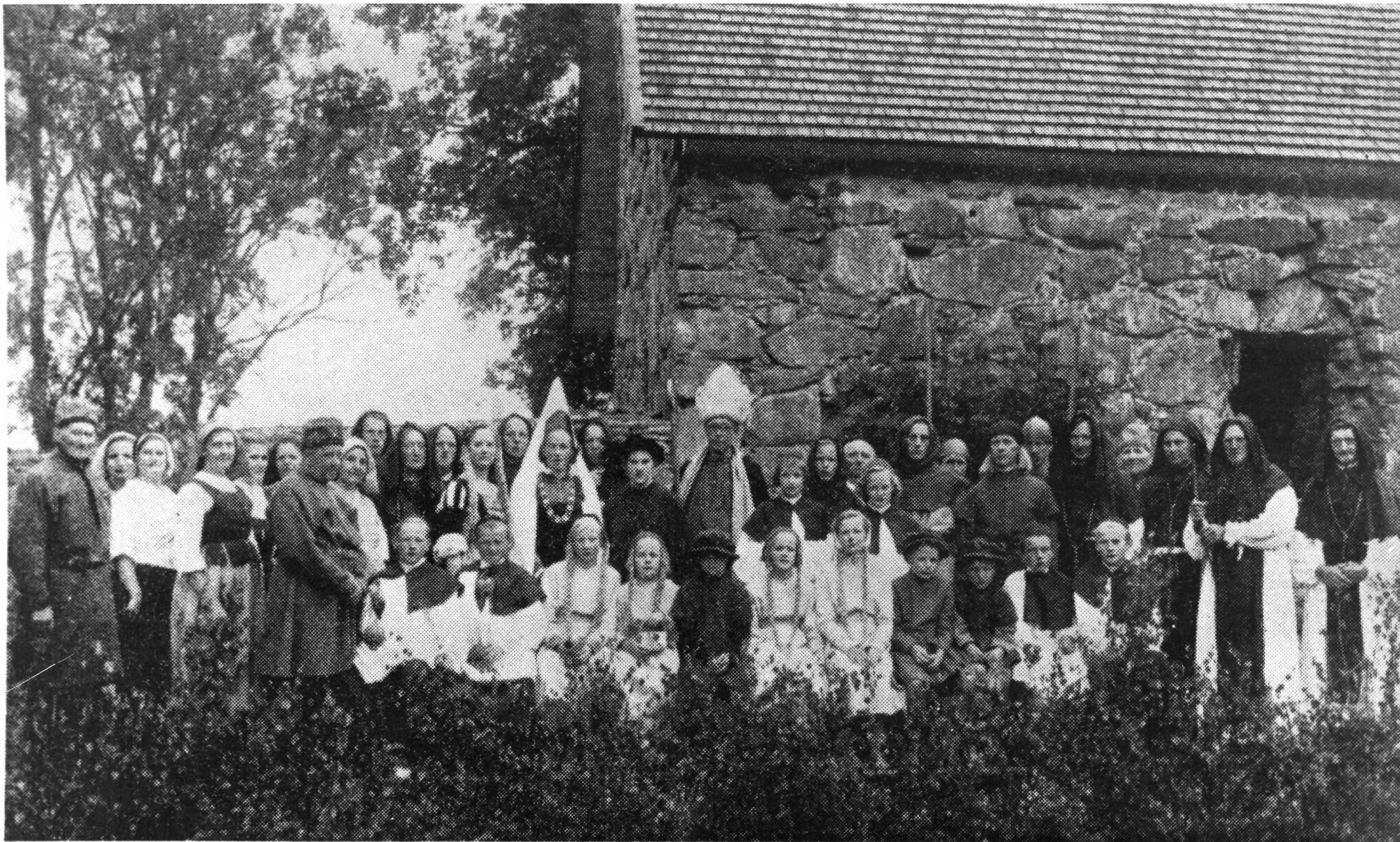
Krönikespelet Nova Vallis