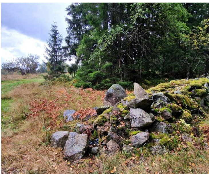
Stenmuren vid Mariedal.