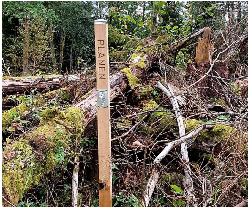
Planens spismursrest går att ana under nedfallna träd. Fransson