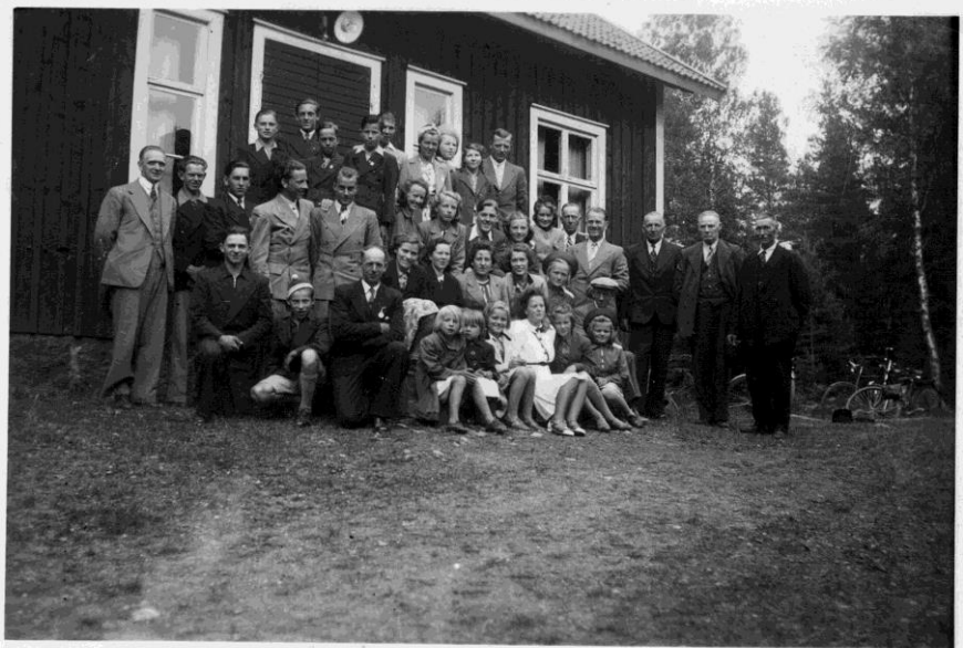
Fredriksdals Missionshus 1941-07-06