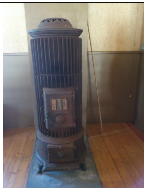
Kostnad 1919 för kaminen, 214,15 kr