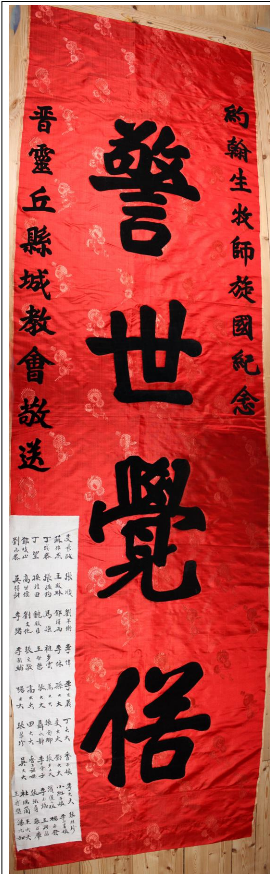
Dukens mått 233x69 cm.