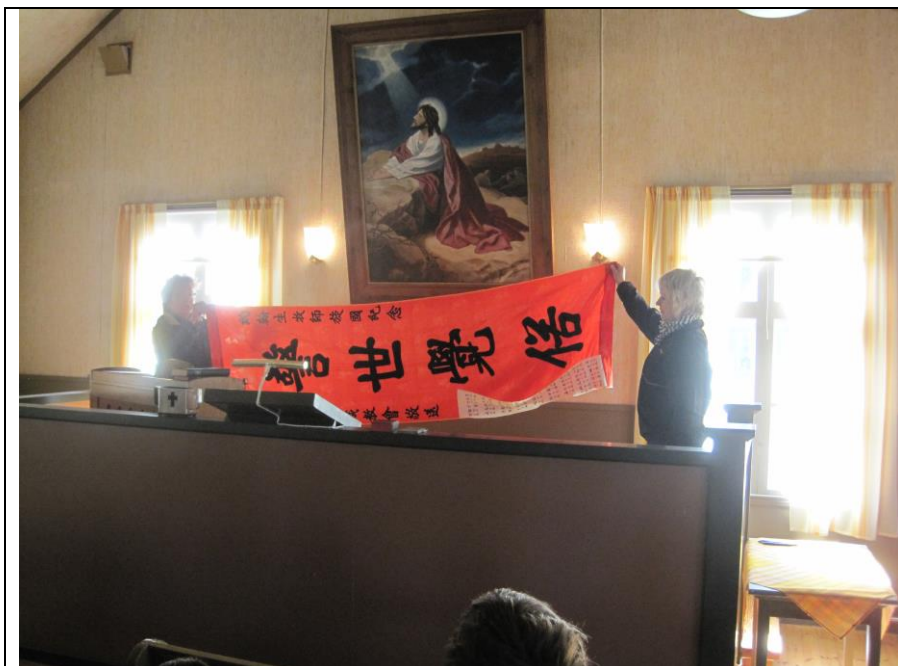
Foto vid Torpinventering maj 2013