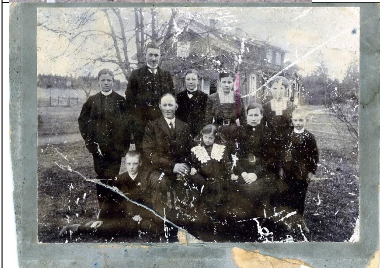
Sveriges Bebyggelse 1955