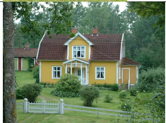
Andersholm. Foto 2002.