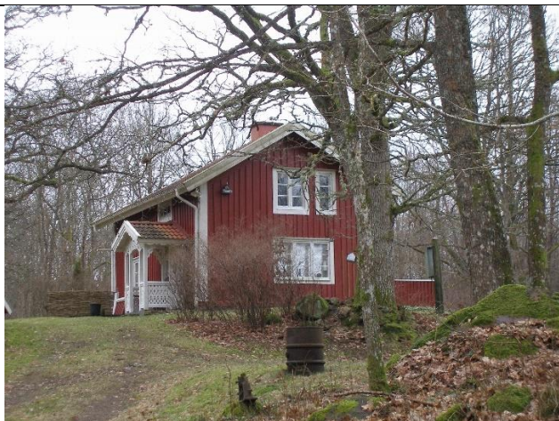
Rosenborg. Foto 2008