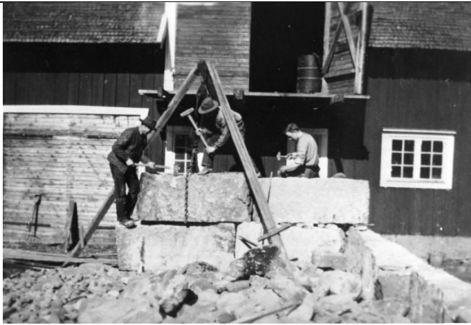
Rättaregårdens ladugård. (Bilder från Nydala)