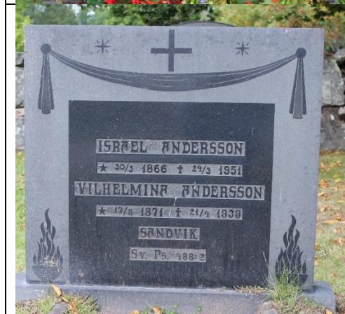
Sveriges Bebyggelse 1955.