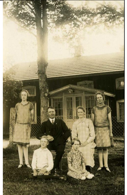
Figur 1, Julafton 1928