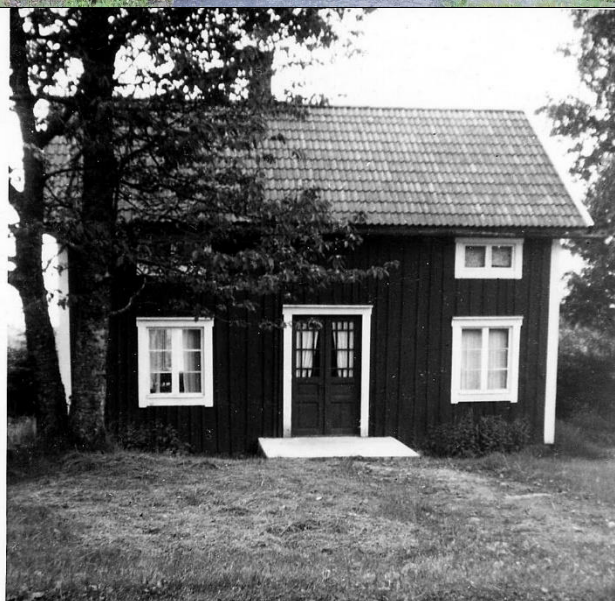
Gamla huset på 1:7