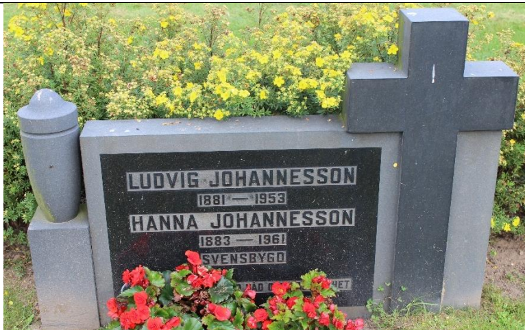
Sveriges Bebyggelse 1955.